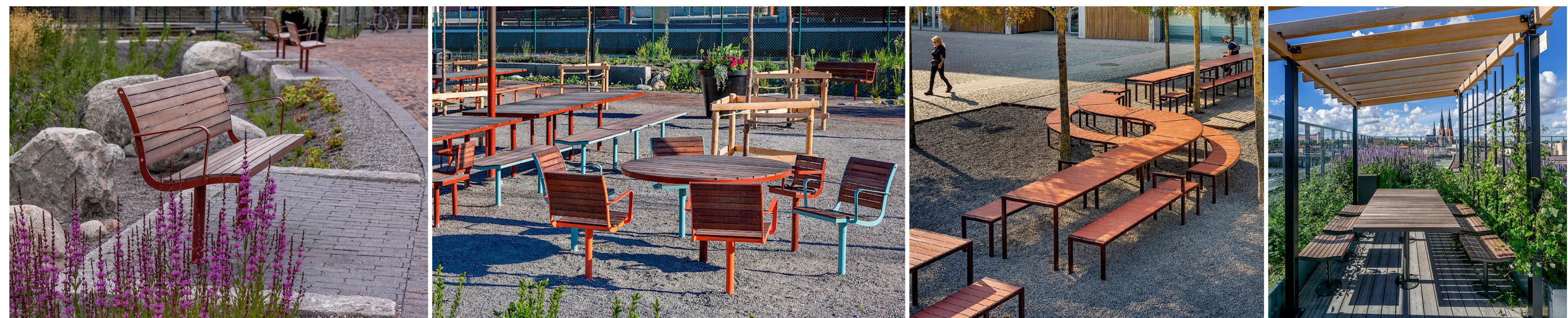
nóla* Parco támasz pad, kőasztal és támasz székek nóla* Lángbontó modulláris bútorcsalád nóla* Parco pergelő

Az utcabútorok esetén hierarchiát határozzunk meg. A nagy számban használt alapvető típusbútorok (támasz ülőpadok, kis- és nagyokkora asztalok, pergelők) kapcsán a révil Nóla cég termékeit közül választottunk. Vannak azonban olyan kitüntetett helyek, ahol különlegesebb, az adott ténz situációra egyedileg tervezett konstrukciók kerülnek – jó analógia erre a „K” épület melletti egyik hársfát körbevezető tanulópad, vagy a Hello Wood táblákon készült objektumok. A parklámpák a mostani gömbölgé hangulatát kortárs formában feléző Lampas termékek.