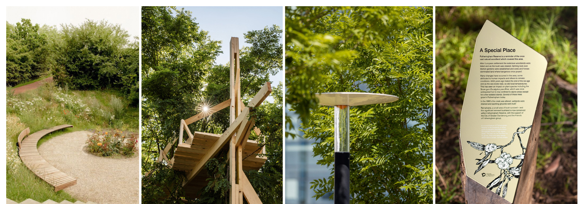
MA&U Planning: Egyedi tervezésű pad, Aktivitás galéria, útvonalak jelölés Hello Wood: Lomhéz, Csúrompuzista lampas* COVER L701 parklámpa Heizez János: Információs tábla, Dandenong Botanical Reserve, Victoria, Australia

Az irányító táblarendszert kapcsán fontos megjegyeznünk, hogy számunkra az arborétum megőrzésére ezen pályázat keretei között elsősorban a terület kert- és tájépítészeti koncepciójának újrarendelést jelenti. A jelenleg égiszes vizuális arculattal nem rendelkező botanikus kert számára szükséges feladatunk gondolkodni egy külön arculattervezési pályázat kiírását, ahol fókuszálhatunk a kert közötti korszerű és szakmai elemek mentén kialakított stratégia születéséhez ennek a fontos kérdésnek a rendezésére.