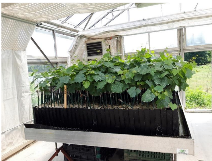
1. ábra - A kísérlet (az 1\text{m}^2 -re jutó oltványok)

A kifejlesztett új oltvány-előállítási, iskolázási módszer technológia folyamata az iskolázás fázisáig megegyezik a konvencionális technológiával. Az előhajtást fűrészesporos vagy perlites közegben javasoljuk elvégezni, amennyiben nem áll rendelkezésre teljesen automatizált klímával ellátott előhajtató helyiség. Szinte egyértelmű, hogy a talajnélküli technológia esetén a kiültetés nem szabadföldbe történik, így iskolázásnál nincs szükség területre, illetve iskolaforgó alkalmazására, így a talaj előkészítésére sem. A szabadföldi kiültetés mellett a kísérletünkben, az innovatívnek nevezhető technológiánál az előhajtattott, szabadgyökeres szőlőoltványok növényházban, természetberendezésben és talajnélküli technológiával kerültek elhelyezésre. A kiiskolázást megelőzően elvégeztük a kiültetendő oltványok előkészítését, illetve oltóviasszal történő kezelését. A kiültetendő növények kézzel, de nem egyéni tálcában (mint a konténeres oltványnevelés esetén), hanem egy közös nevelő berendezésbe kerültek, így szabadgyökerű oltványnevelésről beszélünk. 1\text{m}^2 -re körülbelül 625 db oltvány került (1. ábra).